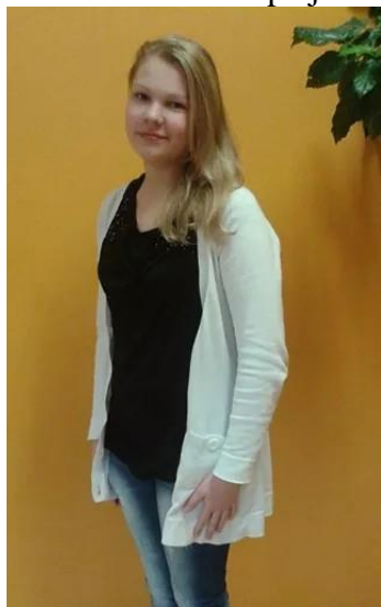
Liisa Tatar Erakogu

Ka meie koolis on palju selliseid õpilasi.