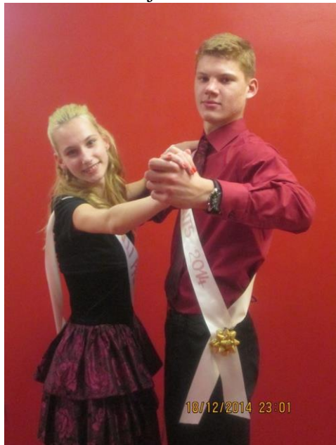
Balli prints ja printsess

Jõuluballil on Rõngu Keskkoolis olnud juba üsna pikk traditsioon. Nimelt toimus see 2014. aastal juba kaheksandat korda.