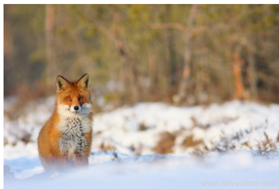
Rebane talve hakul