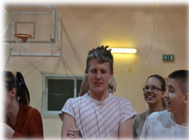
Päev oli värsketele rebastele katsumusterohke